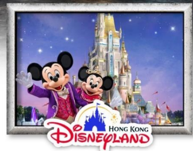
HONG KONG Disneyland

ชมการแสดง แสง สี เสียง Symphony of Lights