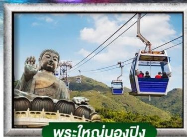
พระใหญ่นองปิง